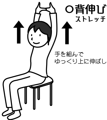
○背伸び ストレッチ

おうち時間が多くなり、体を動かすことが少なくなっていますか？ 今回は、運動不足解消のための簡単な運動を4つご紹介します。どの運動も痛いところまで無理に動かさず、ゆっくりと無理のない範囲で体を動かしてみましょう。