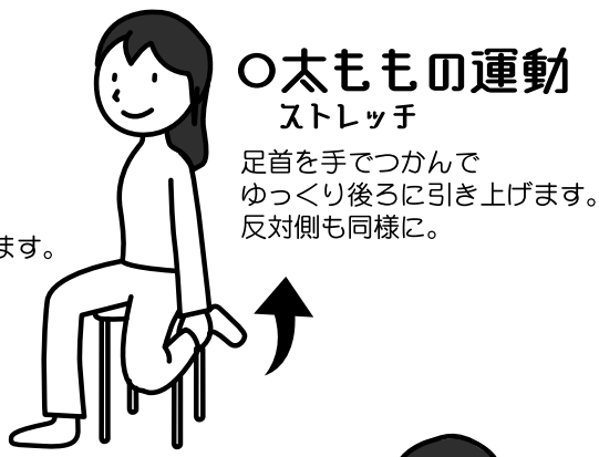
○太ももの運動 ストレッチ