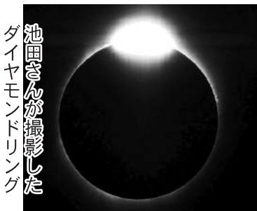
池田さんが撮影したダイヤモンドリング

する理科の教科書作りにも携わっている。「自然科学に興味を持ってもらうことも理科教師の役目です。ライワークです」と言う。(取材=R)